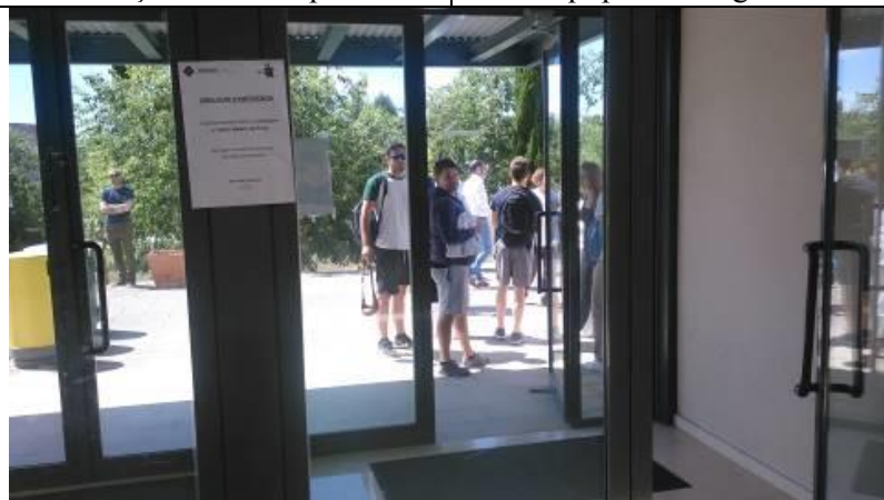
La gent espera que acabi el simulacre