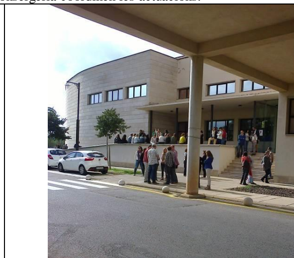
La gent espera que finalitzi el simulacre.