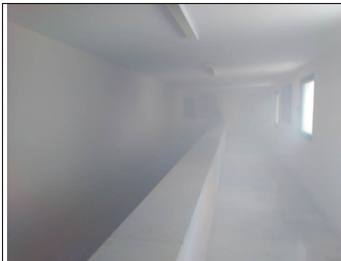
El fum inunda el primer i segon pis.