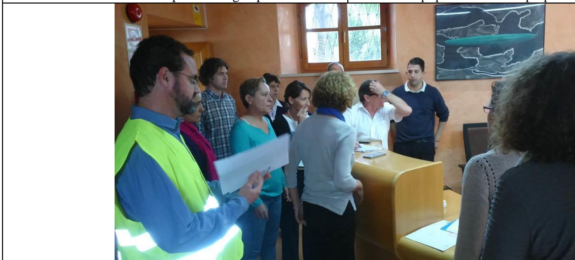
La cap d'emergències i el cap de consergeria coordinen les actuacions.