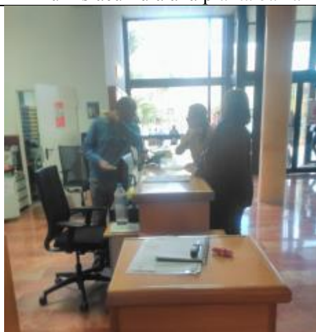
La cap d'emergències coordina les actuacions