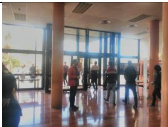
La gent evacua l'edifici