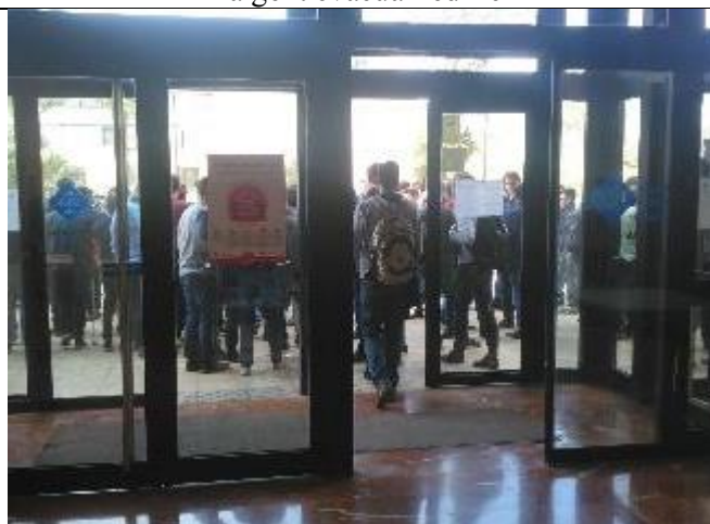
La gent esperant que acabi el simulacre