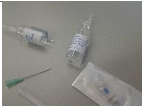
Part del material trobat dins la borsa de fems